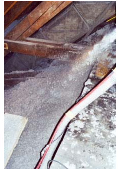
Zvlhčený nástřik na klenbu

Stejnorné rozložení CLIMATIZERu PLUS lze zajistit výškovými značkami. Na silně obloukových plochách