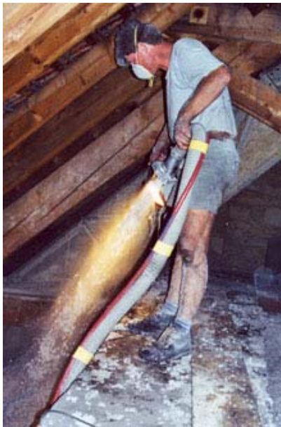
Zvlhčený nástřik na klenbu