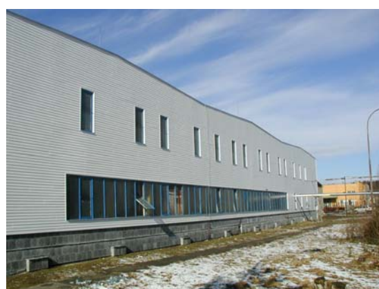
Finalizace fasádním obkladem Vinyl siding

Před instalací desek HFD mohou být do vodorovně položených kazet nataženy šňůry.