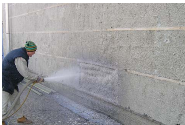
Aplikace Climatizeru nástřikem

Před instalací desek HFD mohou být do vodorovně položených kazet nataženy šňůry.